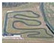
Saint Genis (17)