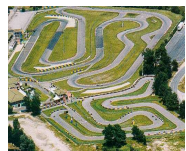
Kart System Mériqnac (33)